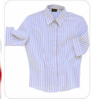
Blusa manga al codo

Tallas CH | MD | GD | XG. Mezcla: 50% algodón 50% poliéster BLANCO ROSA PASTEL AZUL FRANCIA PRETEÑIDO 1 PRETEÑIDO 2 PRETEÑIDO 3