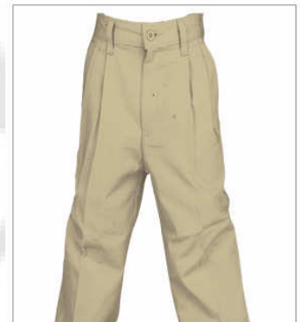
Pantalón casual con resorte

Tallas 4 | 6 | 8 | 10 Mezcla : 100 % algodón KHAKE MARINO OSTION