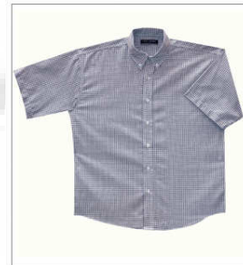
Camisa manga corta preteñida