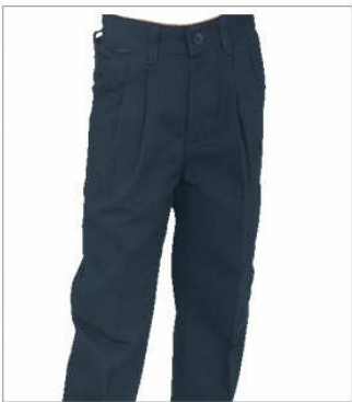
Pantalón casual 2 pinzas

Tallas 12 | 14 | 16 | 18. Mezcla: 100 % algodón KHAKE MARINO OSTION