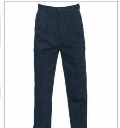
Pantalón casual c/pinzas