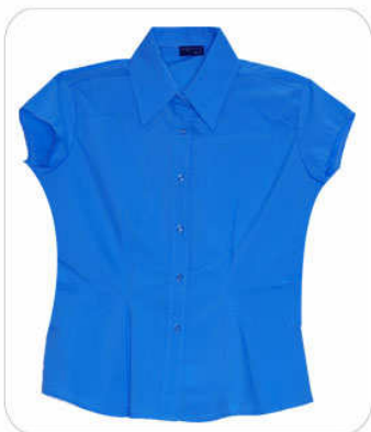
Blusa manga corta

Tallas CH | MD | GD | XG. Mezcla 50% algodón 50% poliéster BLANCO NEGRO ROJO MARINO ROSA PASTEL AZUL FRANCIA