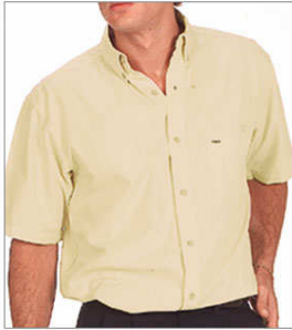
Camisa manga corta 50/50