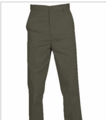
Pantalón casual s/pinzas